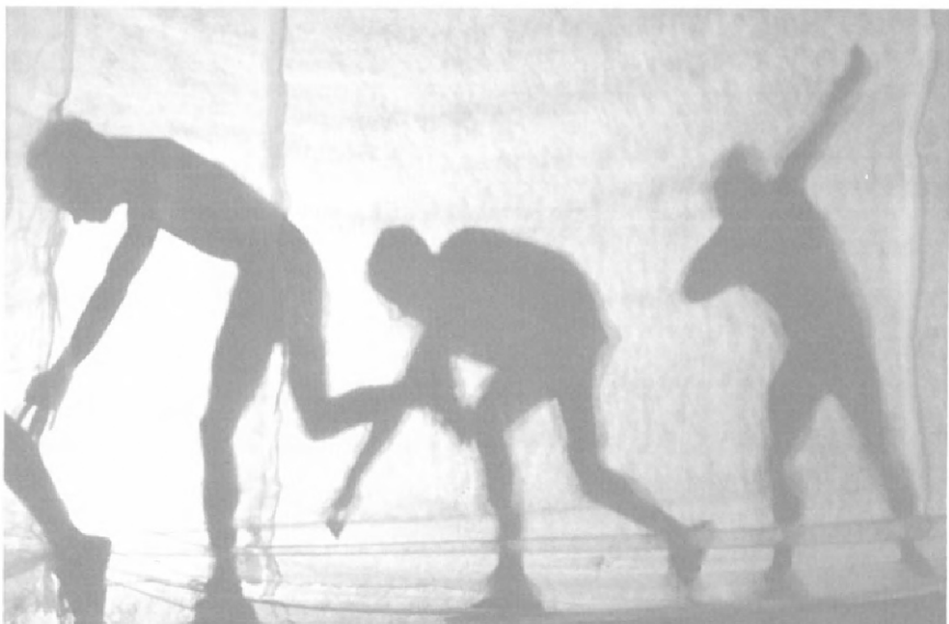
Eindrückliches Schattenspiel der Aktiven