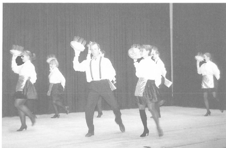
Mit so freundliche Kellner/innen wären die Beizen überfüllt