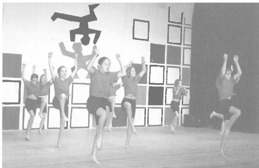
Meitli im Takt