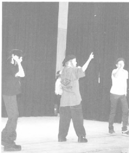
Ist Tick Tack Toe wirklich eine Meitligruppe?