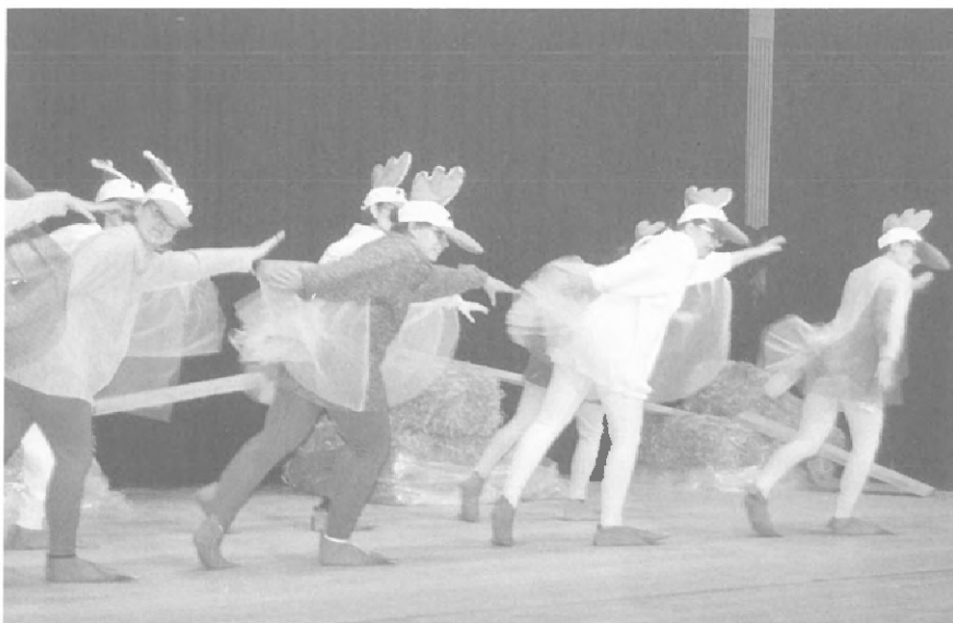
Hühnertanz der Damen